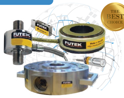
Celdas de Carga