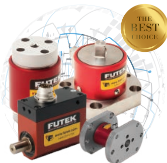
Sensores de Torque