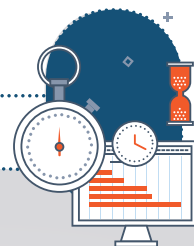
Gestión de Facilities