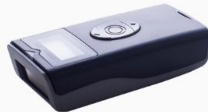
Escáner de bolsillo