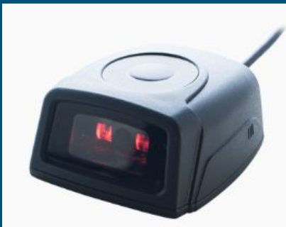
Escáner de montaje fijo