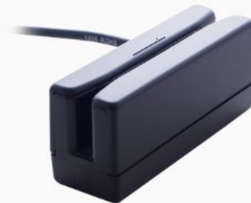
Lectores magnéticos/ de Códigos de barras