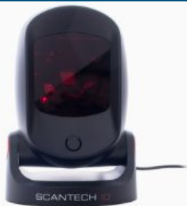
Escáner de escritorio