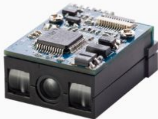
Escáner de código de barras