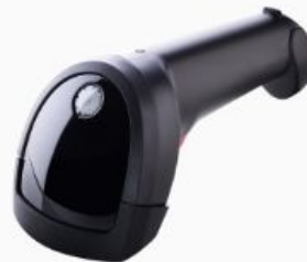
Escáner tipo pistola / de escritorio