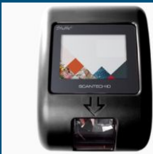
Kiosco de escaneo/ Checador precios